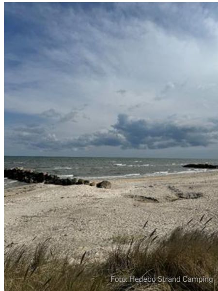
Strandene ved Hedebo Strand Camping har i perioder været tomme i år.

»Danskerne er mere vejrfølsomme end andre. Bliver vejret dårligt, tager de måske til Grækenland i stedet, men hvis det er godt, bliver de i Danmark.«