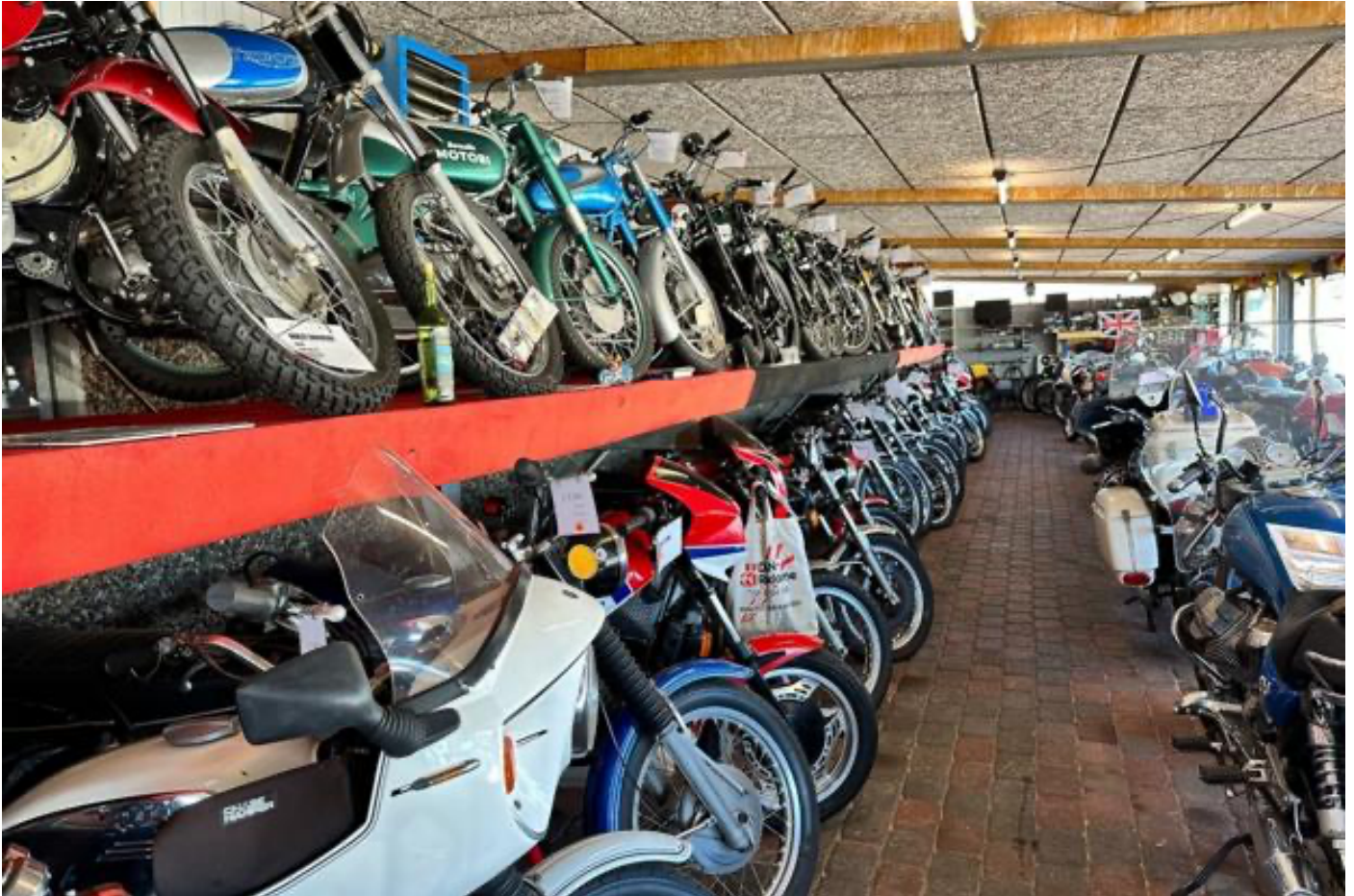
Henning Kjeldsen fra Skagen har overtaget en imponerende samling af motorcykler.

Henning Kjeldsen har købt hele 117 klassiske motorcykler - nu kommer Skagen på danmarkskortet, lyder det