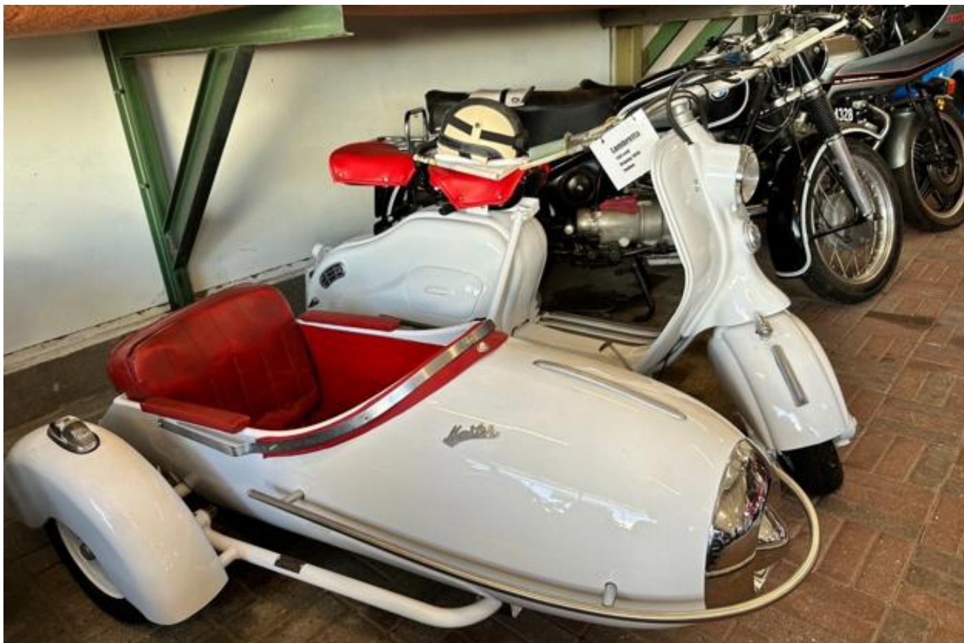
En af samlingens helt specielle køretøjer er denne italienske Lambretta med sidevogn årgang 1956.