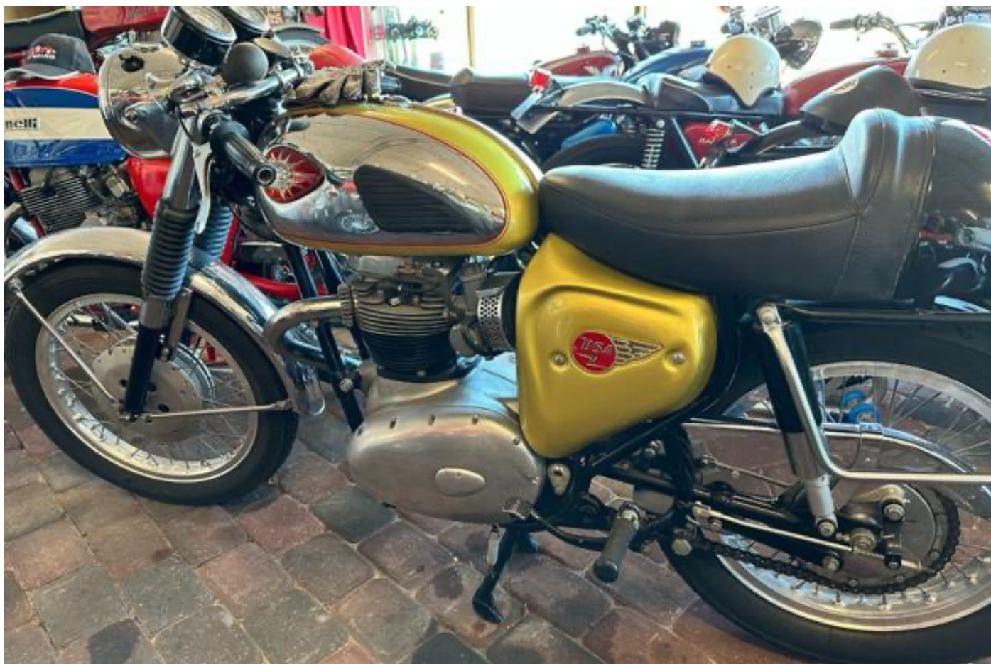
Museet overtager 117 primært tyske, britiske og italienske motorcykler.

Museet overtager 117 primært tyske, britiske og italienske motorcykler (fx Ducati kendt som motorcyklernes Ferrari).